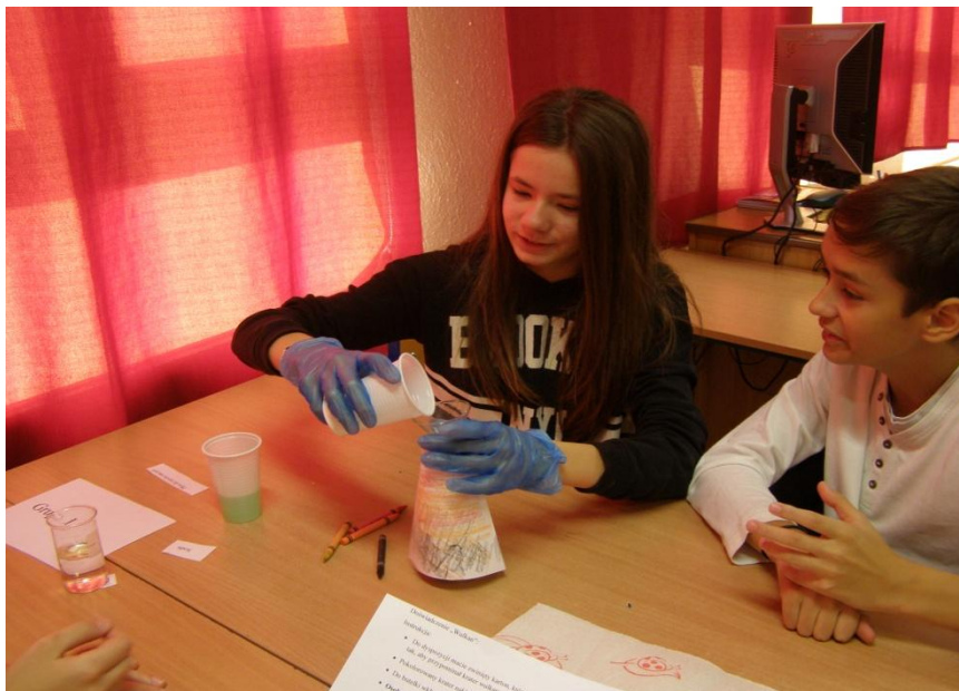
Szóstoklasiści robili wulkaniczne doświadczenia.