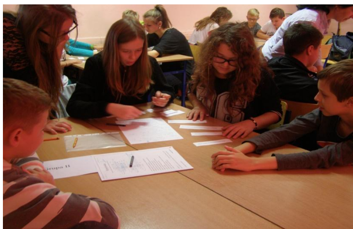
Każda z grup otrzymała kopertę w której znajdowały się kartki z różnymi wydarzeniami historycznymi dotyczącymi historii Płocka. Trzeba je było ułożyć chronologicznie. Czas start!