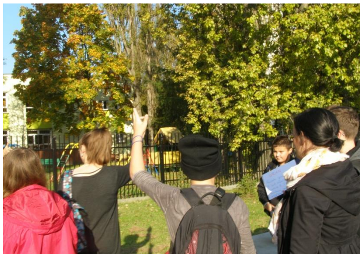
Uczniowie aktywnie brali udział w lekcji.