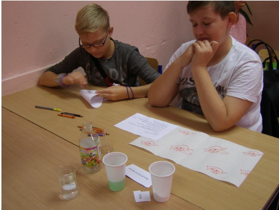
Przed doświadczeniem analiza instrukcji.